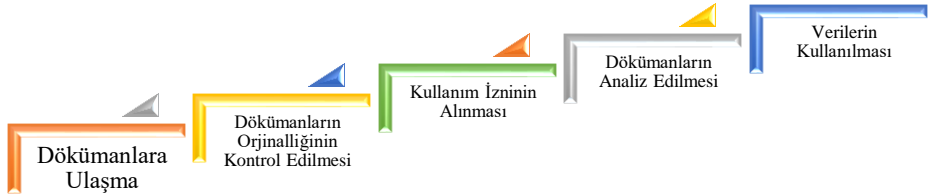
Şekil 1. Doküman inceleme süreci (Baş ve Akturan, 2013).

Araştırmada konusu ve amacı nedeniyle doküman incelemesi metodu kullanılmıştır. Doküman incelemesi; araştırılması hedeflenen olgu veya olgular hakkında bilgi içeren yazılı materyallerin incelenmesi sürecini kapsamaktadır (Yıldırım ve Şimşek, 2016). Şekil 1’de doküman inceleme süreci yer almaktadır. Mevcut araştırma Şekil 1’deki merhaleler dikkate alınarak gerçekleştirilmiştir.