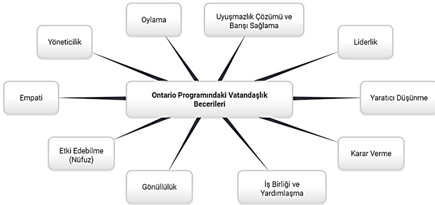
Şekil 5. Ontario Programındaki Vatandaşlık Becerileri 2

meye çalışan öğrencilerin “zaman ve kronolojiyi algılama” becerisinin geliştirilmek istendiği görülmüştür.