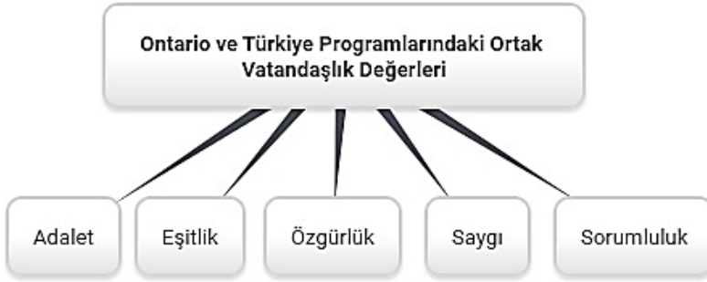
Şekil 4. Türkiye ve Ontario Programlarındaki Ortak Vatandaşlık Değerleri

tilmek istendiği tespit edilmiştir. Belirlenen bu değerlerden bazılarının ortak olduğu görülmüş ve ortak olan değerler aşağıdaki Şekil 4’te sunulmuştur: