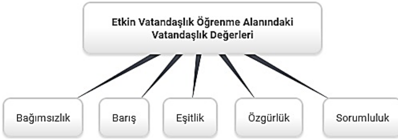
Şekil 3. Türkiye Programı Etkin Vatandaşlık Öğrenme Alanı Vatandaşlık Değerleri

verildiği tespit edilmiştir. Öğretim programı kapsamında belirlenen değerler aşağıdaki şekilde ifade edilmiştir: