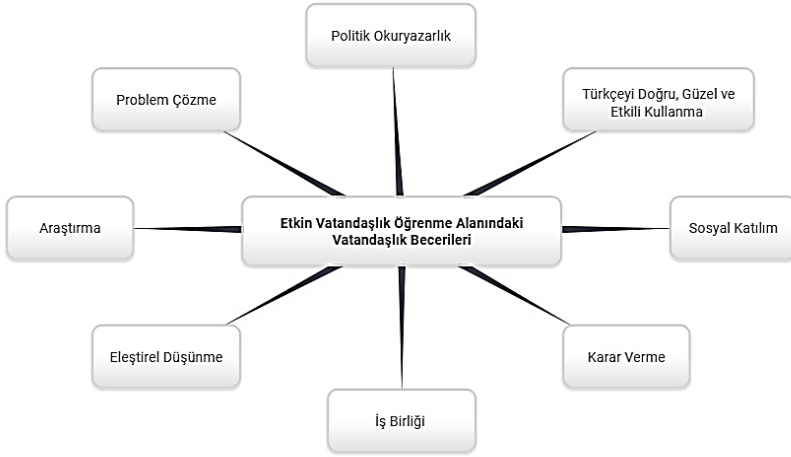
Şekil 6. Türkiye Programı Etkin Vatandaşlık Öğrenme Alanındaki Vatandaşlık Becerileri

Şekil 6’da görüldüğü gibi, “Etkin Vatandaşlık” öğrenme alanı ile vatandaşlık eğitimi kapsamında öğrencilere kazandırılmak istenen sekiz beceri tespit edilmiştir. Böylece araştıran, olaylara eleştirel yaklaşım sorunlara çözüm getirebilen, iş birliği içerisinde sosyal katılım sağlayan bir vatandaş niteliklerine vurgu yapıldığını söylemek mümkündür. Ayrıca diğer öğrenme alanlarında vatandaşlık eğitimi ilgili tespit edilen kazanımlar ve becerilerin eşleştirmesi, aşağıdaki Tablo 3’te sırayla sunulmuştur.