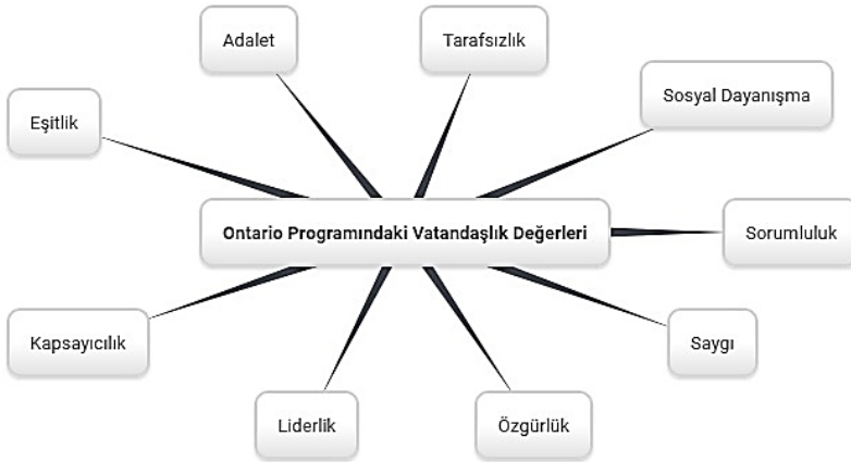
Şekil 2. Ontario Programında Vatandaşlık Değerleri

Ontario öğretim programının genel yapısı incelendiğinde doğrudan “değerler” başlığı altında bir kısma yer verilmediği belirlenmiştir. Programda özel olarak sunulan vatandaşlık çerçevesinden hareketle aşağıdaki değerler belirlenmiştir: